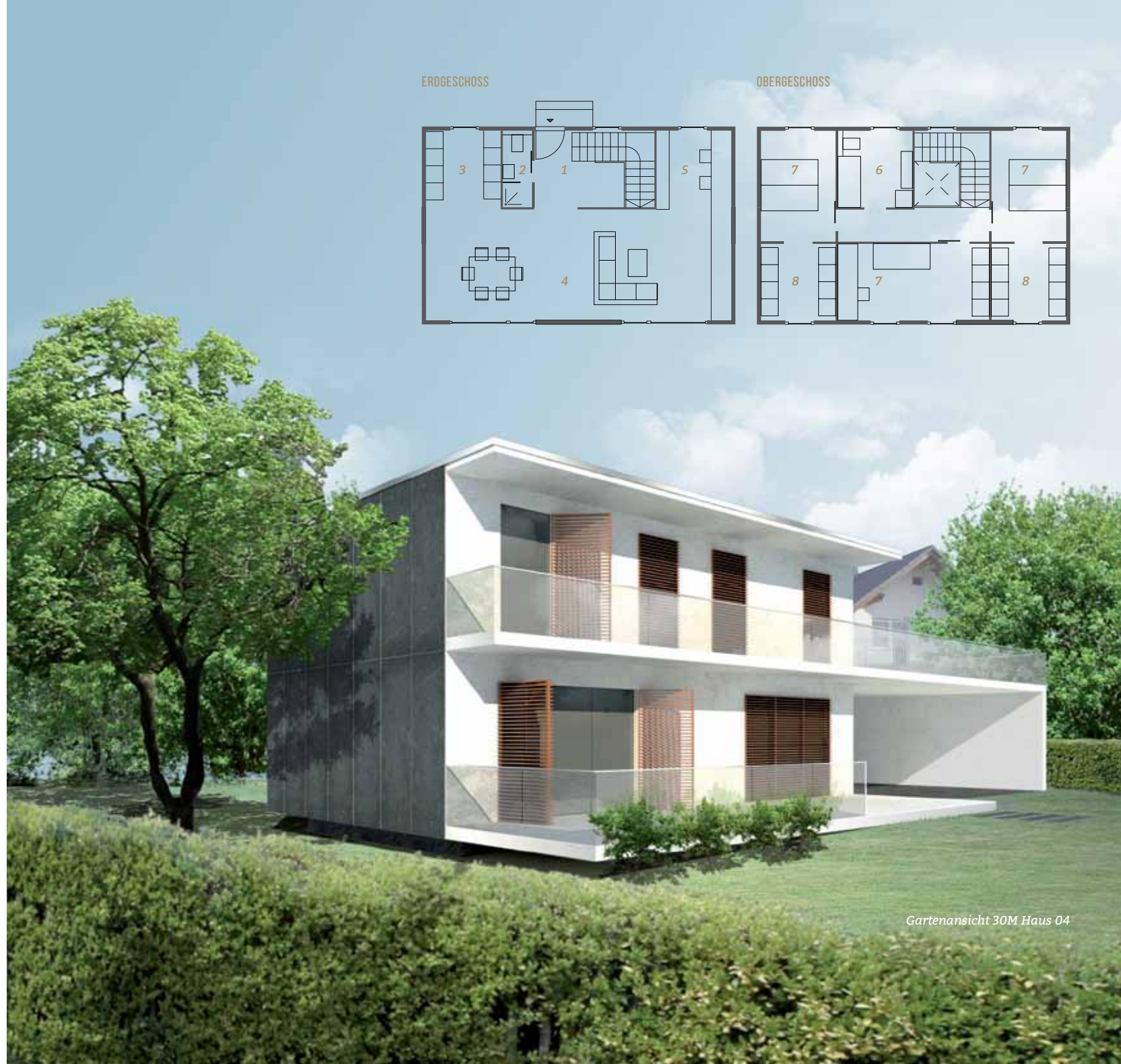
Gartenansicht 30M Haus 04